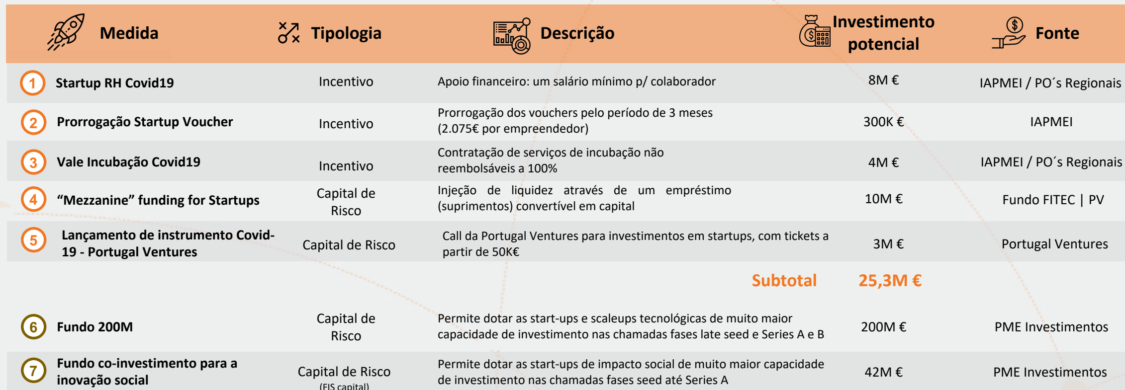
Tabela Resumo de Medidas de Apoio